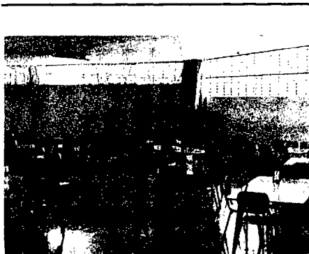
Aspecto del Comedor de la Guardería "Lea de Serfaty" en el "23 de Enero"

Ante la excelente acogida y muchas felicitaciones recibidas por las Damas Israelitas Pro-Canastillas, esta organización que cuenta con más de treinta años de actividad en el País, se siente cada vez más comprometida a seguir por el loable sendero que se ha trazado.