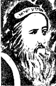
חברה קדישא חסד ואמת

Organizada por la Hebrá Kadishá "Hesed Veemet", tuvo lugar en la noche del pasado 23 de Mayo la celebración de la Hilulá de Rabbi Shimhon Bar Yohay en la Sinagoga Tiferet Israel, con una nutrida concurrencia.