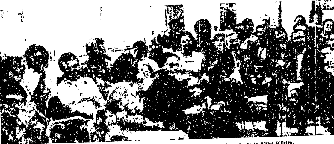
Vista del público existente al seminario de dirigentes, efectuado en la sede de la B'Nai B'Rith.

los valores de los judíos. Ello necesariamente lo dirigirá hasta una interpretación sionista de su Historia, que ayudará a forjarlo como un hombre auténtico cuando empiece a cumplir un papel legítimo en beneficio de su pueblo y del mundo desde su milenaria tierra.